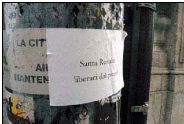
Un altro dei manifesti antiracket.

Pizzo su tutto, agli ordini delle due donne: sulla pesca del tonno, sui pedalò, sui servizi turistici, su ogni attività economica compresa fra Alcamo e Castellammare, perfino sulle troupe cinematografiche. È quello che emerge dall'inchiesta "Tempesta", condotta dalla squadra mobile di Trapani. Come del resto per rischio-pizzo fu costretta a emigrare fuori Palermo la troupe di un film girato a Brancaccio, il quartiere a rischio di Palermo dove fu ucciso il parroco don Pino Puglisi.