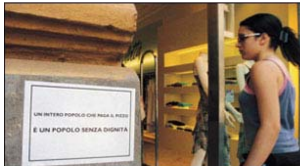
Uno dei manifesti affissi dai "ragazzi antiracket" davanti a un negozio nel centro di Palermo.

Come la banda di Robin Hood, anonimi e notturni si muovono senza lasciare tracce: sono i "bravi ragazzi antiracket" di Palermo. Di notte attaccano manifesti esplosivi che scuotono le coscienze: "Un intero popolo che paga il pizzo è un popolo senza dignità". Coraggiosi ed elettronici, non rispondono mai ai cellulari, ma guardano il display e richiamano solo se il numero è di un amico fidato, circospetti perfino negli indirizzi e-mail (pppsss,ttuuu@hotmail.it), danno appuntamenti alle fermate dei bus.